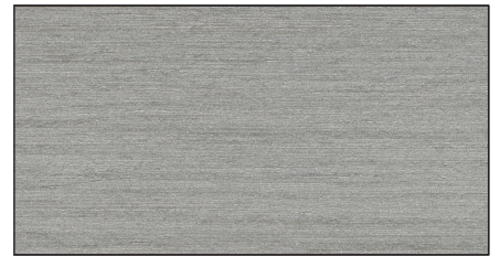
platingrau ▪ platinum grey Art.-No. 7313