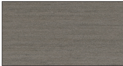
graphitgrau ▪ graphite grey Art.-No. 7312