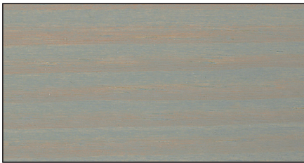
silbergrau ▪ silver grey RC-970 · Art.-No. 7309