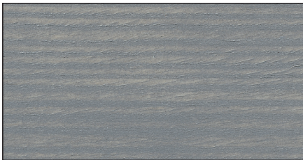
wassergrau ▪ water grey FT 20924 · Art.-No. 7314