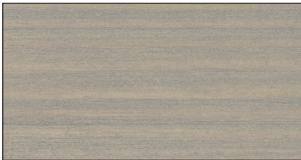
sandgräu ▪ sand grey FT 20927 · Art.-No. 7314