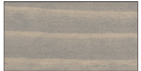
lehmgräu ▪ clay grey FT 20926 · Art.-No. 7314