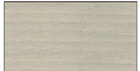
nebelgräu ▪ misty grey FT 20930 · Art.-No. 7314