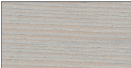
fenstergräu ▪ window grey FT 20931 · Art.-No. 7314